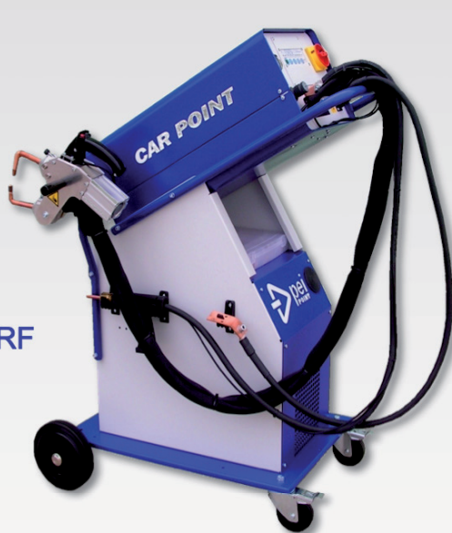
CAR POINT 8 CAR POINT 11 RF